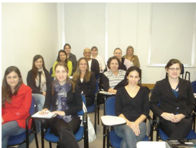
Alunas do Curso de Atualização em Tecnologias para Secretárias.

Em parceria com o SISERGS a Plano B realizou, no dia 14/5, o curso Atualização em Tecnologias para Secretárias na sede da FEDERASUL em Porto Alegre.